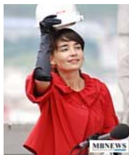
Жилищный комплекс «Премьер»