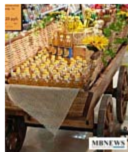
Открытие супермаркета «Сити Гурмэ»