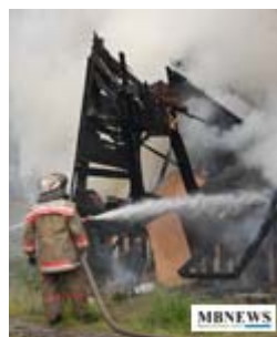
Пожар на улице 6-ой Комсомольской батареи